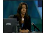
Gestión integral de la seguridad en TI