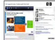
Transformación del Centro de Datos