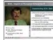
SOA - Impacto en los Data Centers Europeos