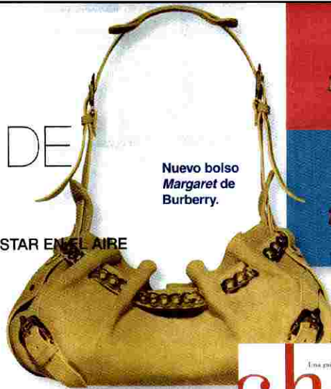
Nuevo bolso Margaret de Burberry.

LO ÚLTIMO Y LO MÁS CHIC PARA ESTAR EN EL AIRE